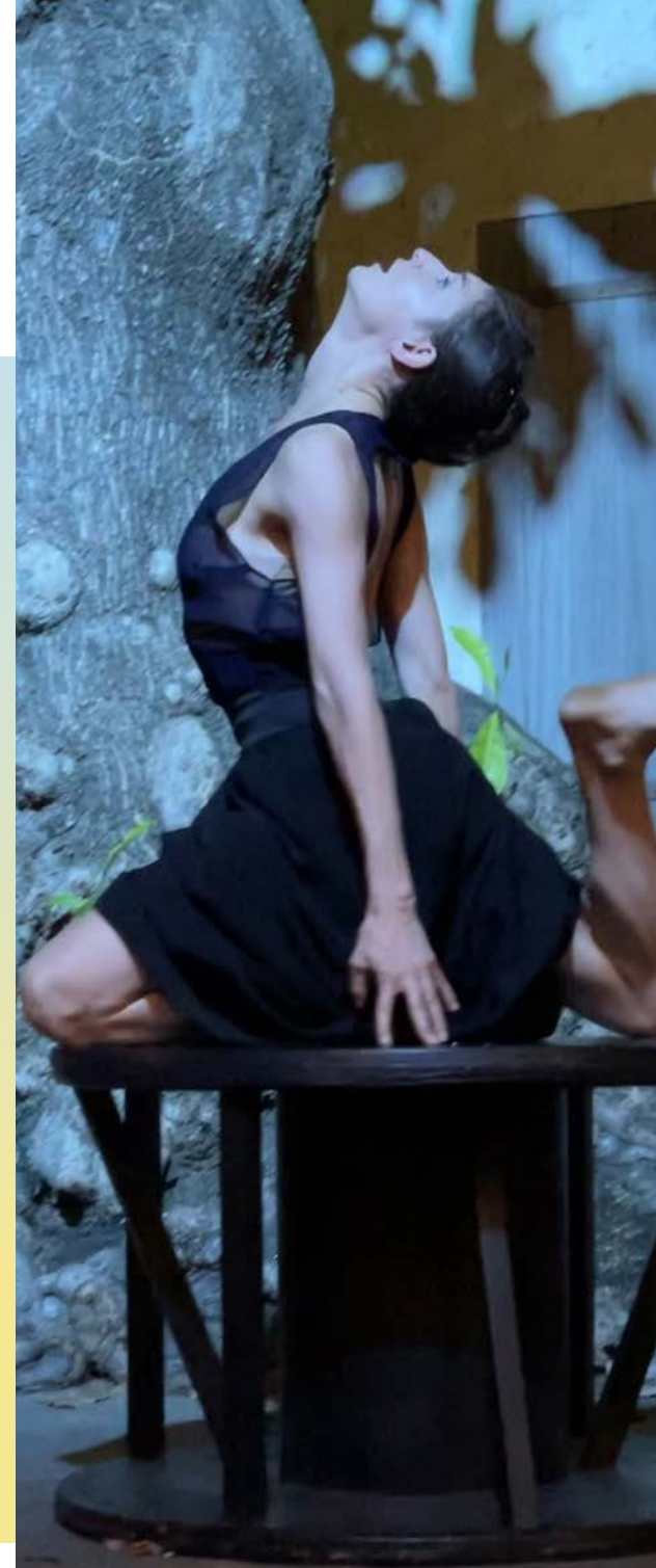
In the palm of your hand