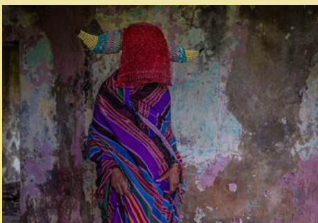
TAURÉ ©Jean Marc Lacaze.

> 26/10 - 10/11 À 20H - FRICHE DE L'ANCIENNE USINE - PIERREFONDS