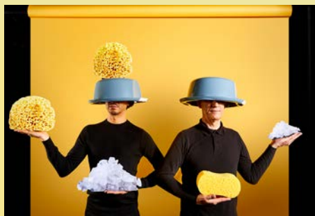
Jérôme Brabant et Pierre Fourny ©Souffle.

>30/09 À 10H & 19H - TPF >05/10 À 15H - TDS >07/10 À 10H & 18H - L'ALAMBIC & SGB