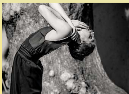
In the palm of your hand ©Sebastien Fraysse.