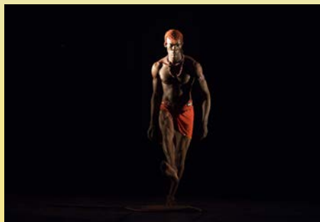
Traditional future