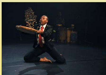
O bom combate