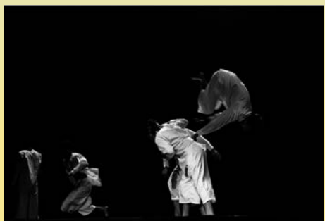
Tourbillon ©Julie Iarisoa.