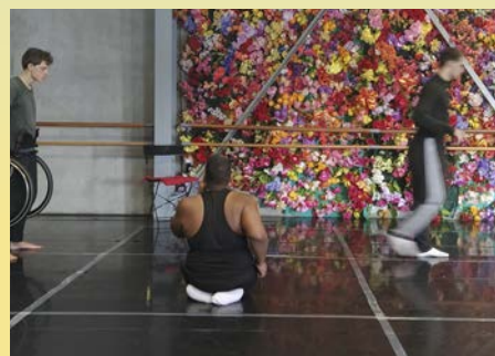
Les illuminés